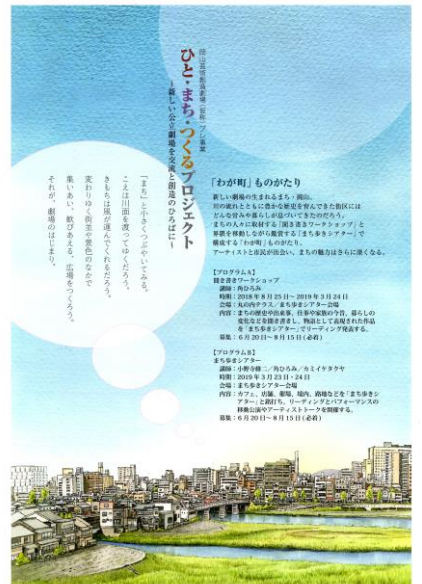
「わが町」ものがたり 2018年

ひと・まち・つづめるプロジェクト 新しい文化芸術施設を交流し創造のひろばに ～新しい文化芸術施設を交流し創造のひろばに～ ひと・まち・つづめるプロジェクト 新しい文化芸術施設を交流し創造のひろばに ～新しい文化芸術施設を交流し創造のひろばに～