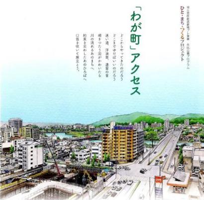
「わが町」アクセス 2021年