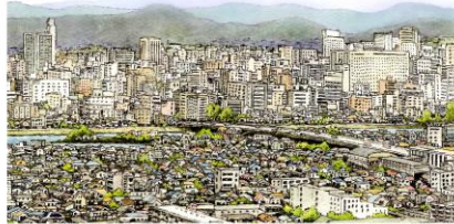
「わが町」ワークショップ 2017年